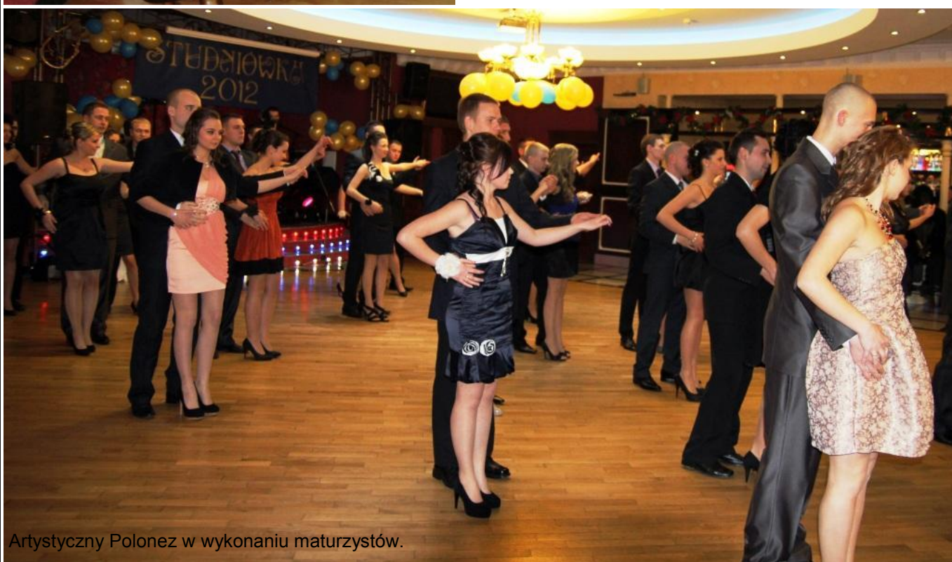
Artystyczny Polonez w wykonaniu maturzystów.