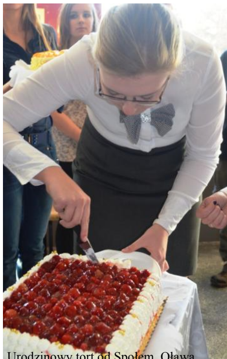
Urodzinowy tort od Społem Oława