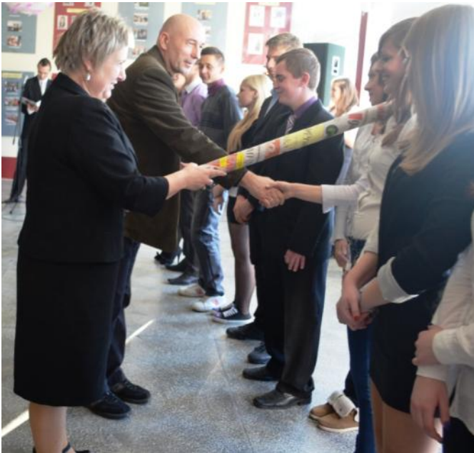
Uroczyste pasowanie na dziennikarza.