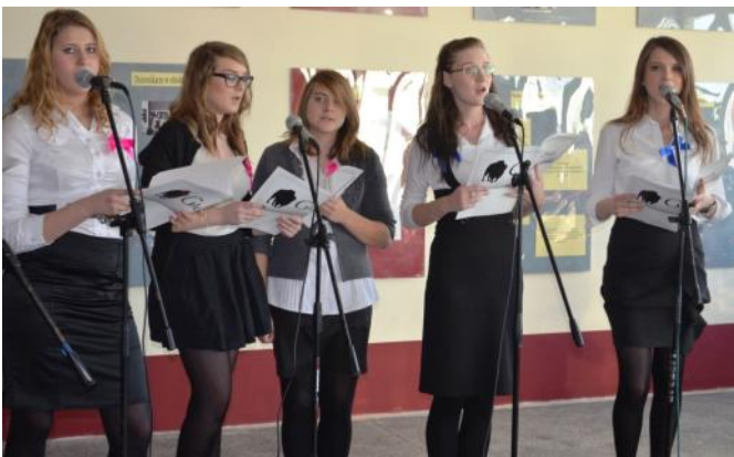
Choco zaśpiewały dla Żubra.

Mamy już za sobą pięciolecie Głosu Żubra i pasowanie pierwszoklasistów na dziennikarzy. Odbyło się także otwarcie galerii w szkole. Trzy wydarzenia jednego dnia. Jak to wyglądało?