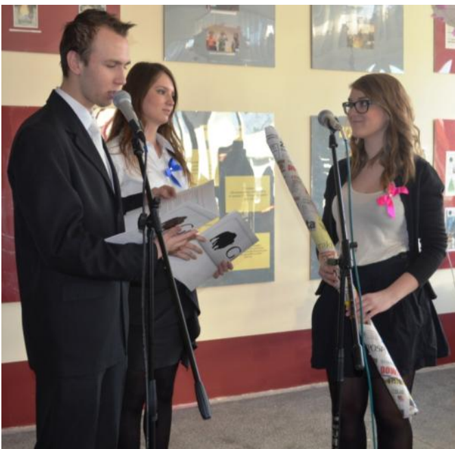
Przekazanie dziennikarskiego rulonu.